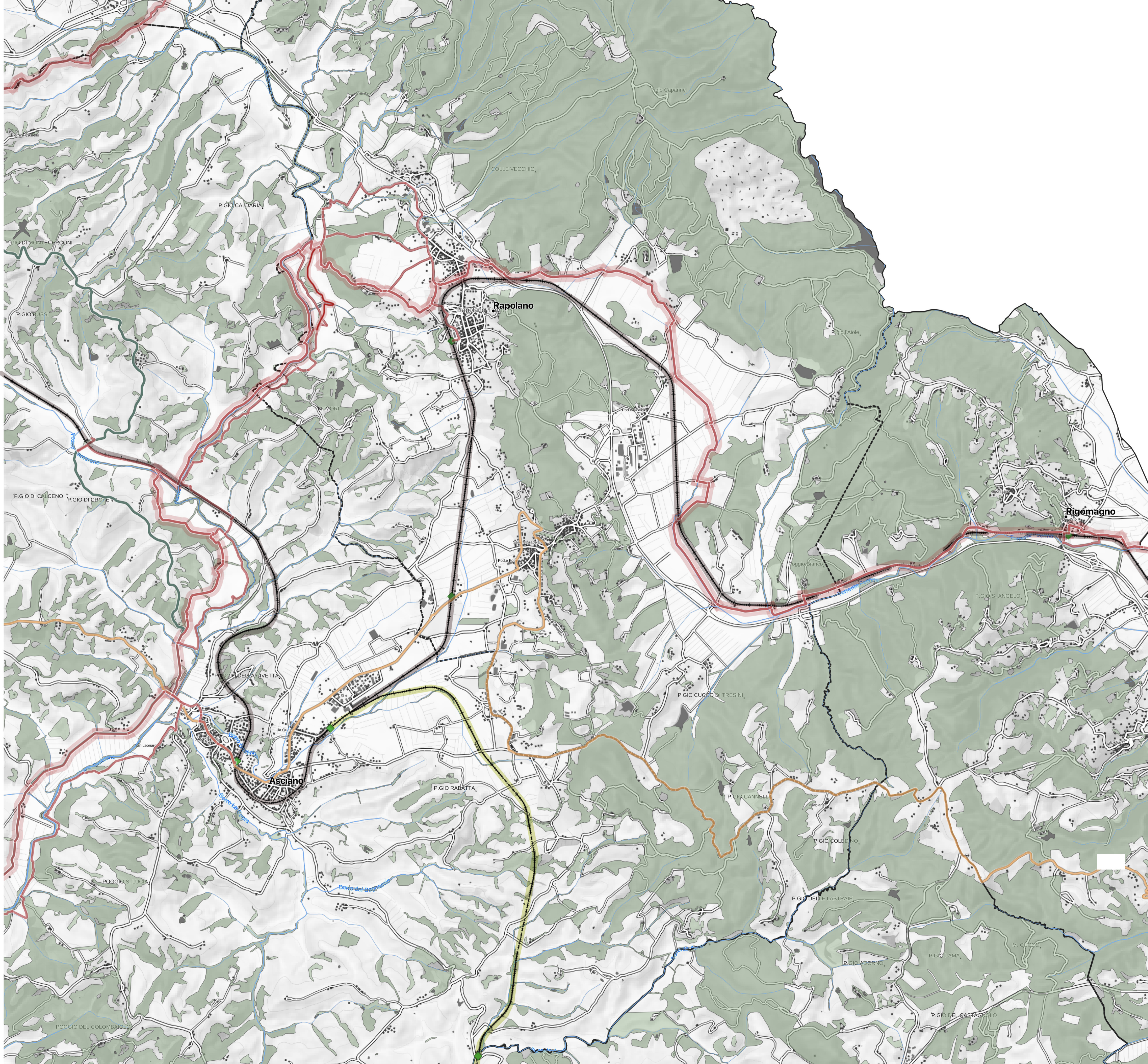
tavola PP 3 N scala 1:25000

tecnico incaricato: Arch. Ilaria phd Burzi, phd in progettazione del paesaggio ilaria_burzi@hotmail.it collaboratore: arch. Michela phd Moretti